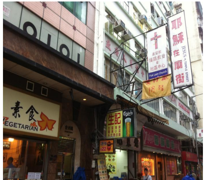
(上圖)擴堂會址：金利閣 1 樓