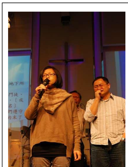
黎余巧雲牧師及同工為教會合一禱告