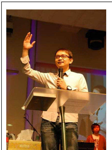
基督教屯門福臨教會 正式宣佈獨立。