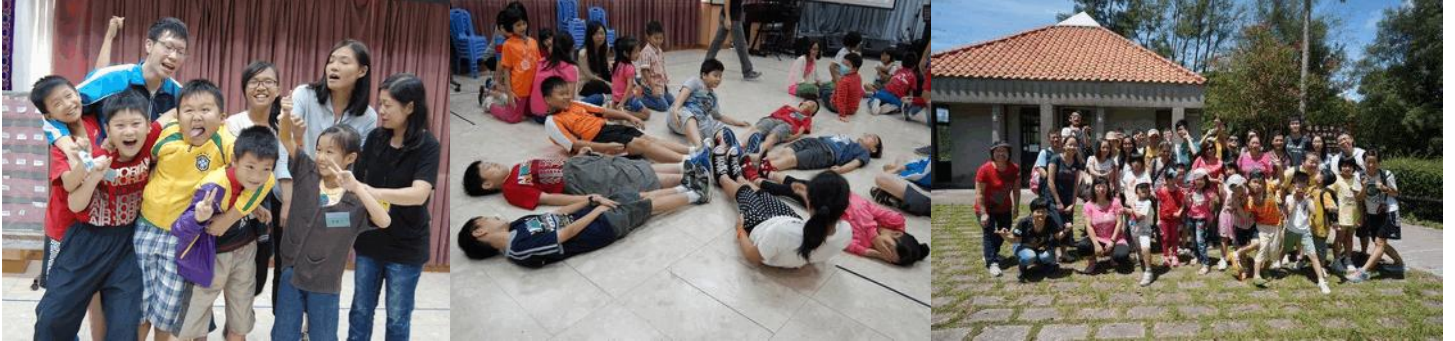
(代代相連參加者,大多數來自社區基層的家庭.)

在愛回家的服侍中，約有 70 個義工和 20 個受助的小朋友參加。最感動的，是這次活動讓我們在教會內建立了一個彼此包容、接納的家。此外，義工們在完成愛回家行動後都有新的成長，特別是愛耶穌的心，因為服侍小朋友和隊工，他們對愛有更深入的理解和體會。