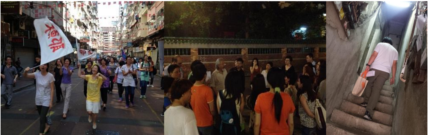
(廟街行區祈禱,社區探訪)

整個行動，讓我們有機會接觸社區的居民，對居民的現況更有許多新的發現。過去 25 年以來，油麻地廟街一帶的社區和人事都不斷轉變，唯一沒有改變的，就是耶穌對這個社區的愛與關懷。透過探訪，我們將「耶穌的愛」帶進每一家、每一戶，「廟街大行動」正正具體地呈現「耶穌在廟街」的意義。